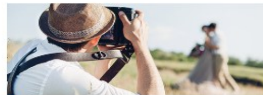
Фото- и видеосъемка на заказ

Продажа продукции собственного производства