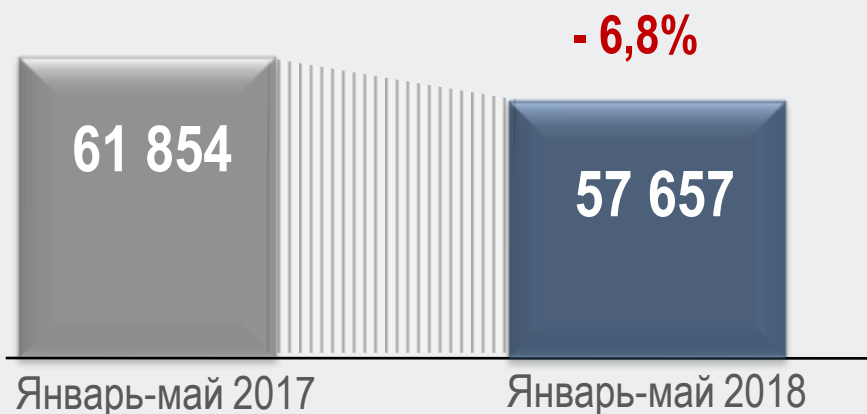
Консолидированный бюджет Российской Федерации