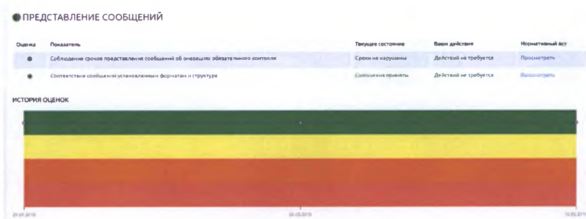
Рисунок 3 – блок «Представление сведений»

Расчет оценки блока «Представление сведений» осуществляется по показателям «Соблюдение срока представления сообщений об операциях, подлежащих обязательному контролю», участвуют представленные сообщения за указанный период (неделю), и «Соответствие сообщений установленным форматам и структуре».