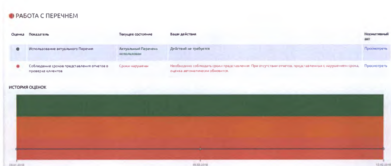
Рисунок 4 – блок «Работа с Перечнем»

На рисунке 4 представлен блок «Работа с Перечнем».