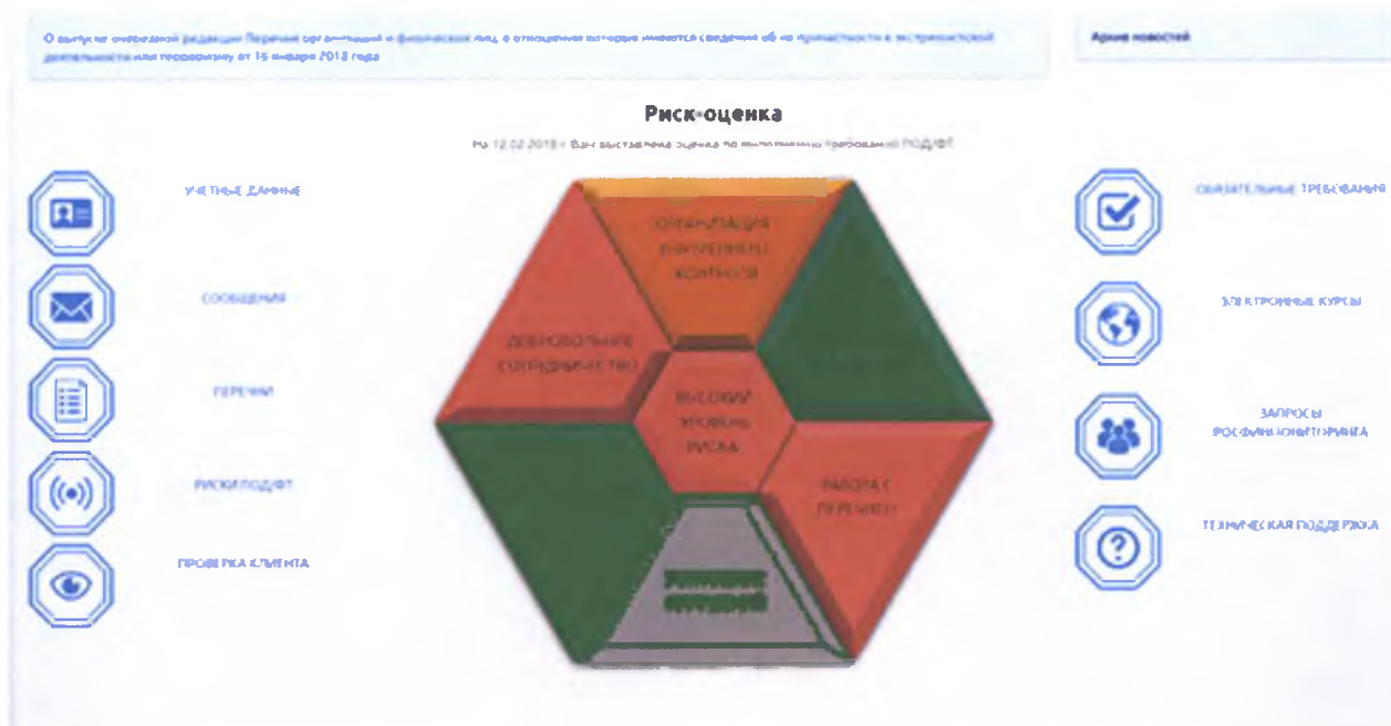
Рисунок 1 – Вид риск-оценки и ее блоков

Риск-оценке и каждому блоку присваивается одно из следующих значений: