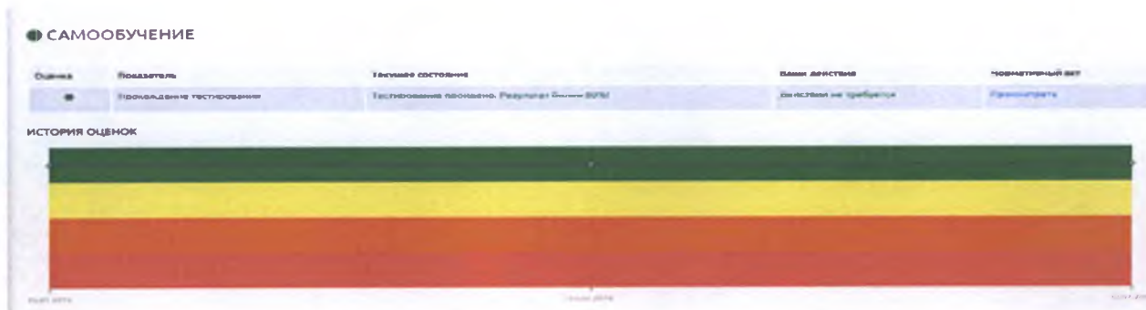
Рисунок 6 – блок «Самообучение»

Блок не участвует в расчете интегральной риск-оценки.