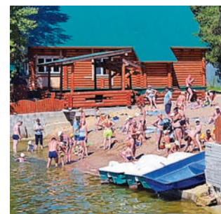
ОТДЫХ НА ПЛЯЖЕ ЯВЛЯЕТСЯ ОДНИМ ИЗ КЛЮЧЕВЫХ ФАКТОРОВ ПРИ ВЫБОРЕ ТУРБАЗЫ