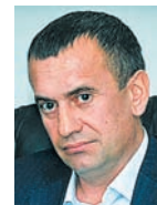
А.В. МУРЗОВ, председатель комитета по транспорту, автомобильным дорогам, информационным технологиям и связи Самарской гуддумы:

«В комитет поступило коллективное обращение от организаций, занимающихся оказанием услуг в сфере телекоммуникаций, по вопросу улучшения инфраструктуры для поддержания стабильного сигнала сотовой связи и внедрения новых информационных технологий, направленных на улучшение качества жизни жителей области. Мы направили его на рассмотрение профильной общественной комиссии.»