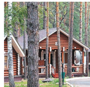
НА МНОГИХ ТУРБАЗАХ ВЫСОКОГО УРОВНЯ ПУТЕВКИ РАСКУПЛЕНЫ ДО КОНЦА ЛЕТА

Минимальная стоимость проживания в «Парке-отеле Васильевский» – от 3500 руб. в сутки на двоих.