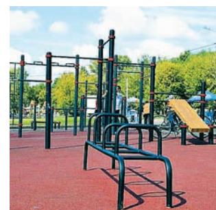
ПОЧТИ ВСЕ ТУРБАЗЫ ИМЕЮТ НА СВОЕЙ ТЕРРИТОРИИ СПОРТИВНЫЕ И ДЕТСКИЕ ПЛОЩАДКИ