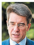
С.В. ФИЛИППОВ, министр культуры Самарской области:

- В последние годы фестиваль принимает от 20 до 30 тысяч гостей. Мы не стремимся сейчас к какой-то гигантомании и понимаем, что прошли те времена, когда фестиваль собирал больше ста тысяч. И, может быть, к лучшему. Сегодня на фестиваль приезжают именно те, кто действительно интересуется авторской песней, любит ее, и от этого культурный уровень фестиваля в целом вырос.